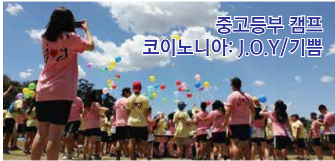
중고등부 캠프 코이노니아: J.O.Y/기쁨