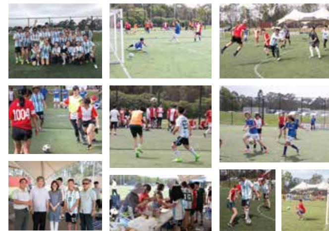
4일(주일) 청년 아미쿠스컵 축구대회가 개최되었다. 승리는 Y.I.C (Youth In Christ)팀이 남성 혼성 두종목을 우승하였다.