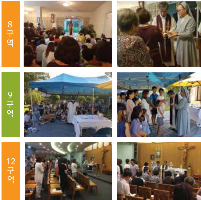
2일(금) 8구역, 3일(토) 9구역과 4일(주일) 12구역의 구역 판공이 진행되었다.