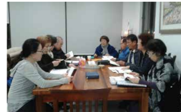
5월 18일(금) 9 구역 1 반 반모임