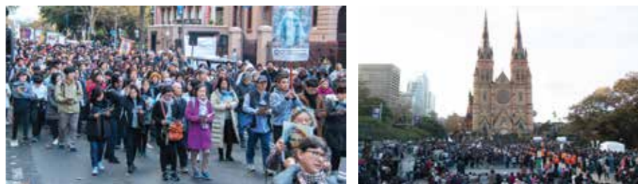
3일(주일) 오후 2시 30분, 시티 마틴플레이스부터 St Mary's 대성당까지 성체 행렬이 있었고 우리 공동체의 많은 교우들이 참여했다.