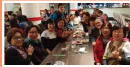
6월 2일(토) 성모회 야유회가 Gosford와 Terrigal에서 있었다.