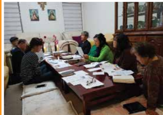
10월 12일(금) 1구역 3반 반모임