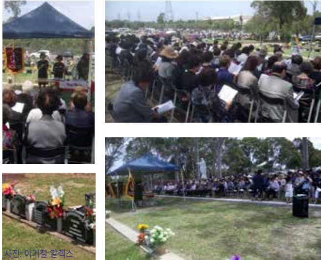
4일(토) 교중 미사 후 Rookwood 한인 천주교회 공동 묘지에서 레지오 마리아에 묘지방문 위령기도가 있었다.