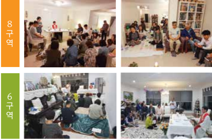
13일(토) 8구역과 14일(주일) 6구역을 끝으로 총 12개 구역의 판공을 모두 마쳤다.