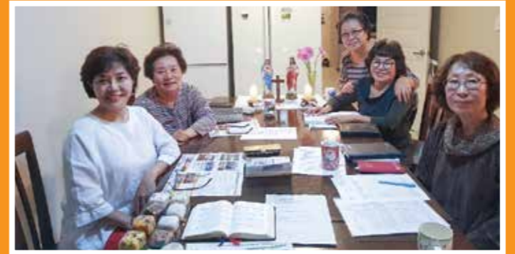
9일(화) 2 구역 5반