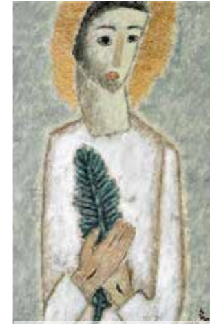
승리하신 그리스도 - 김옥순 수녀

돌아가셨던 주님이 주일 아침에 나타나셨습니다. 구원역사의 새 시간이 시작됐습니다. 성 금요일 예수님은 죽음의 세계인 저승으로 가시어 당신 죽음이 우리의 죽음을 이기셨습니다. 부활성야는 오늘 의 세계에서 참 교회의 모습입니다. 우리도 현 세상과 작별해야 하지만, 이미 영적으로 세례 때 죽었습니다. 하지만 하느님 아들로써 물에서 다시 일어났습니다. 육신이 죽는 순간이 올 때, 세례 때 이미 살았던 생명을 우리는 다시 취할 것입니다. 예수님의 부활을 가장 먼저 발견한 건 여인들이었습니다. 그들이 먼저 무덤에 갔기 때문입니다. 그러나 무덤에서 곧장 예수님의 부활을 본 건 아닙니다. 여인들이 부활보다 먼저 확인한 건 빈 무덤이었습니다. 예수님을 믿고 따랐던 이들에게 주님이 십자가에 못 박혀 죽은 사건은 너무나 믿어지지 않는 충격이었을 것이 분명합니다.