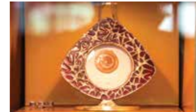
제대 위에 안치된 김대건 신부 유해

수선 탁덕 김대건은, 김대건 신부가 모든 조선인 가운데 가장 앞서고 뛰어난 사제임을 가리키는 중국식 표현으로, '최초의 신부 김대건'의 책 속에 나오는 내용이다. 이번 사순절에 이 책을 읽은 것이 내겐 주님 은혜로 여겨진다. 우리 본당 주보 성인이신 김대건 신부님과 한국 순교성인들에 대해서 나는 평소에 그다지 관심이나 주의를 기울이지 않았다. 하지만 이 책을 읽은 후 나는 성당에 모셔진 김대건 신부님의 유골이 매우 귀하게