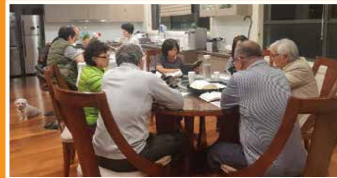
15일(월) 5 구역 7반