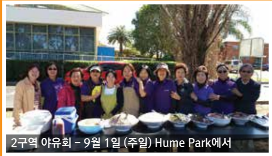
2구역 야유회 - 9월 1일 (주일) Hume Park에서