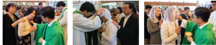
8일(주일) 교중 미사 중 총 51명의 성인 세례식과 첫 영성체가 있었다.