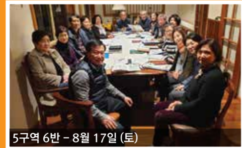
5구역 6반 - 8월 17일 (토)