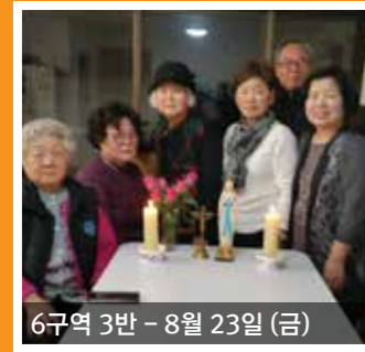
6구역 3반 - 8월 23일 (금)