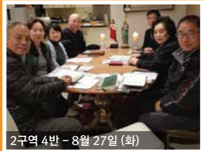
2구역 4반 - 8월 27일 (화)