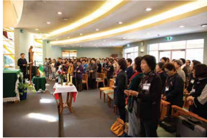
9월 28일(토) Divine Word Missionaries 에서 레지오 마리아 피정이 있었다.