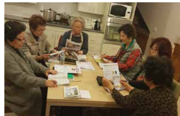
9월 9일(월) 7구역 7반