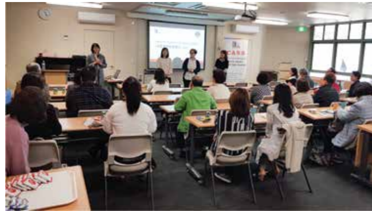
9월 29일(주일) 가브리엘 방에서 카스 장애인 서비스 설명회가 있었다.