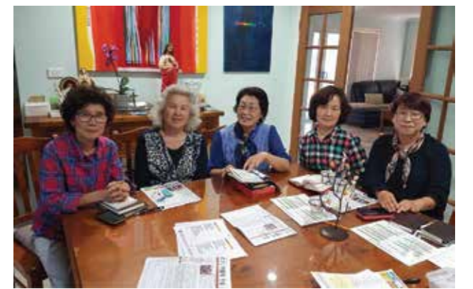
10월 3일(목) 10구역 3반